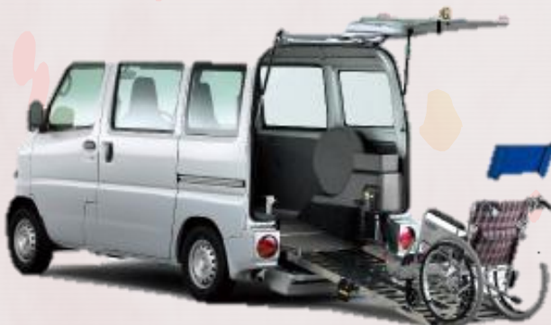
日産タウンボックス