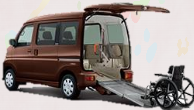
ダイハツアットレースローパー