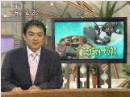
首都圏ニュースでの放映